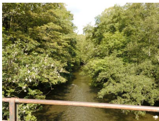
Figure 3 & 4. Parking le long de la rue «Pont-à-Lesse » - Vue des berges en amont du pont de fer