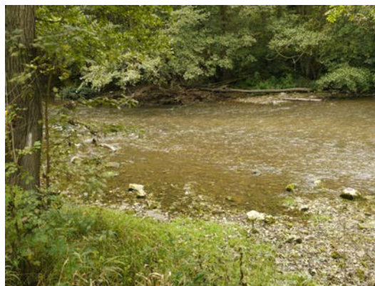
Figure 1 & 2. Barrage à partir duquel la Lesse devient banale – Spot praticable en rive gauche, en aval du barrage