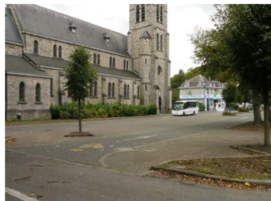
Figure 17 & 18. Parking le long de la rue du Vélodrome en se dirigeant vers la Meuse – Stationnement possible place Baudouin 1 er à Anseremme