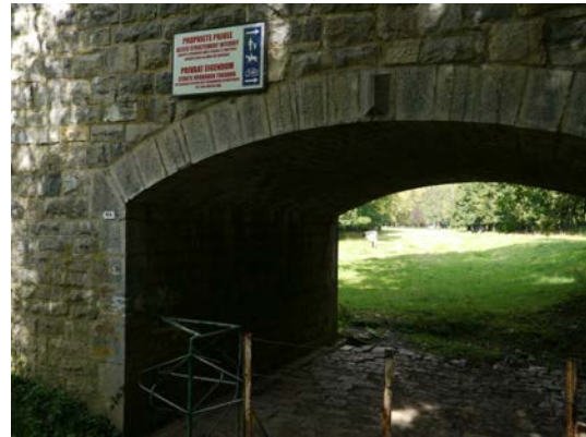
Figure 5 & 6. Vues en aval du pont de fer à Pont-à-Lesse – Pâturage accédant à la berge en rive gauche