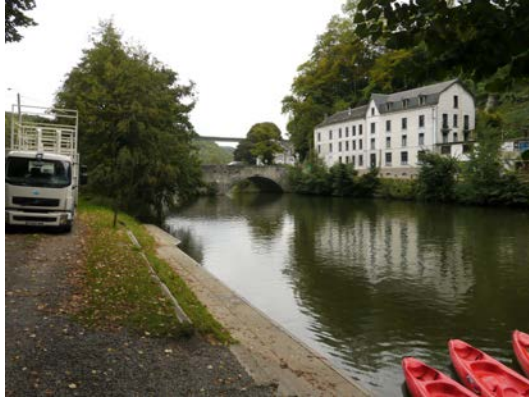
Figure 19. Zone de confluence avec la Meuse