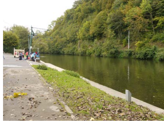
Figure 13 & 14. Parking le long de la rue des Forges – Chemin des Halages au niveau des Forges en rive gauche