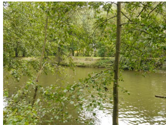
Figure 11 & 12. Vues de la rive droite, au niveau du hameau des Forges