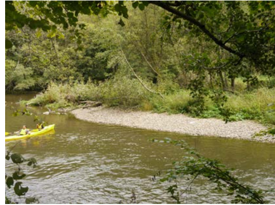
Figure 9 & 10. Spot praticable en rive droite , entre Pont-à-Lesse et les Forges – île praticable en aval de Chênet