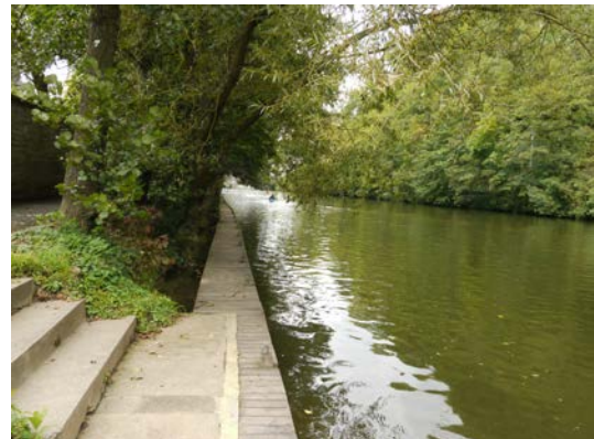
Figure 15 & 16. Parking, rue du Vélodrome à Anseremme – Ponton latéral en bois en rive gauche