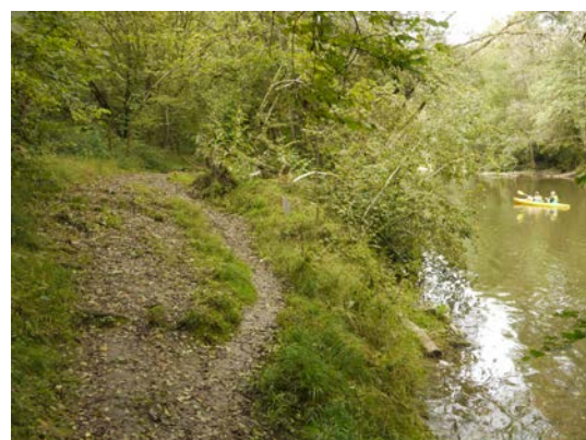
Figure 7 & 8. Chemin de Halage longeant la berge depuis Pont-à-Lesse jusqu'à Anseremme – Spot praticable en rive gauche au niveau de Chenet