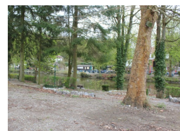
Le jardin au bord de la Sambre

Inauguration officielle de l'exposition et du jardin à 17h suivi du verre de l'amitié.