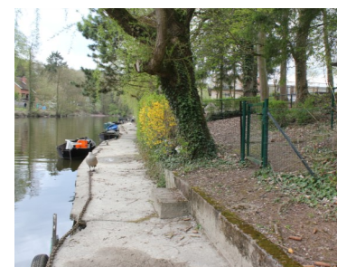
Le bord de la Sambre

D'autres partenaires sont également associés à cette synergie. Il s'agit du Plan Communal du Développement de la Nature, du Contrat de Rivière Sambre et affluents, des pêcheurs et les écoles de l'entité.