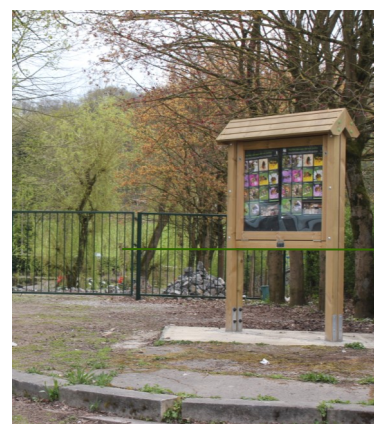
Entrée - vue du jardin

Par ailleurs, une sensibilisation à la nécessité de la protection de la nature et du cadre de vie sera diffusée auprès des établissements scolaires de la commune.