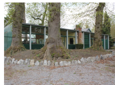
Le Pavillon (vue du jardin)

Informations touristiques et historiques de la région : « Sambre Rouge » en collaboration avec le Chaf et la Maison du Tourisme de Thuin.