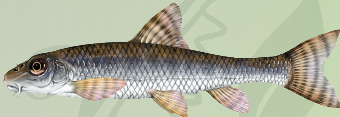
© Illustration de poisson / P.J. Dunbar