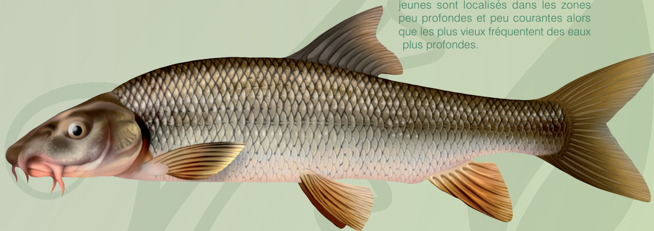
© Illustration de poisson / P.J. Dunbar

Ce poisson possède un corps allongé, cylindrique et fin. La forme de son ventre est adaptée à la vie sur le fond. Munies de deux paires de barbillons, les lèvres de sa bouche sont épaisses et charnues. Ses nageoires caudales sont de teinte orangé (sa nageoire anale et pelvienne également).