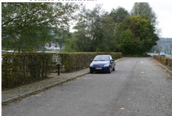
Figure 15 : Parking de Champalle