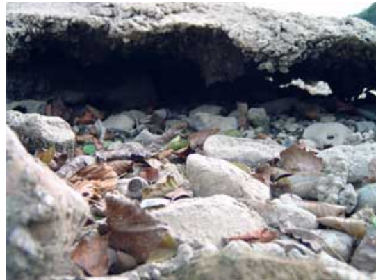
Figure 18 & 19 : Banquette en béton désolidarisée du lit de la Meuse