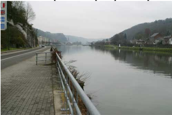
Figure 11 : Chaussée d'Yvoir à la sortie de Dinant