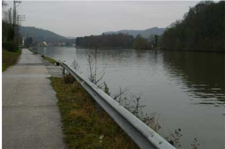
Figure 20 : Halage en aval du pont de Heer