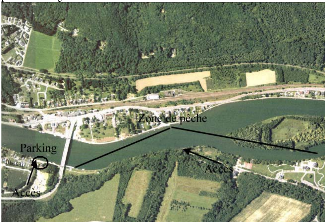
Figure 3 : Zone de pêche située entre le pont de Heer et le Domaine des Sorbiers