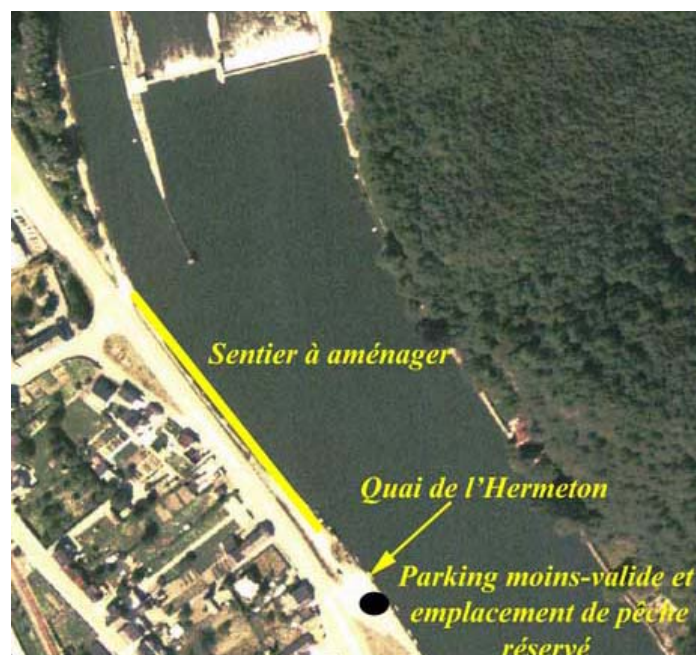
Figure 21 : Quai de l'Hermeton