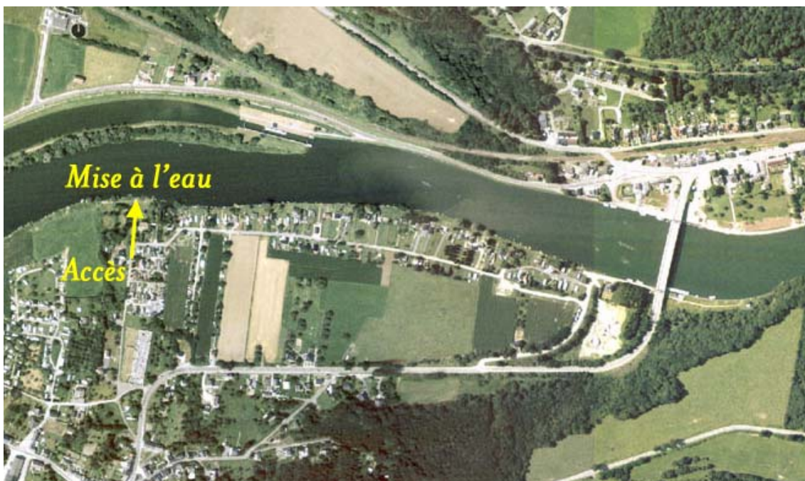
Figure 2 : Vue d'ensemble de la Meuse mitoyenne

léger mais il devrait permettre la mise à l'eau des barques et les déversements dans le cadre des rempoissonnements. Il est nécessaire de pouvoir approcher à proximité immédiate de l'eau avec des bassines. Un ponton collectif d'amarrage de barques de part et d'autre de la rampe constituerait un plus. Cet aménagement n'est pas localisé sur un site Natura 2000 (voir annexe 1).