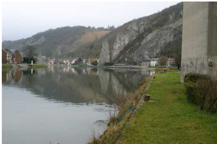
Figure 8 : Rue Caussin à hauteur du viaduc