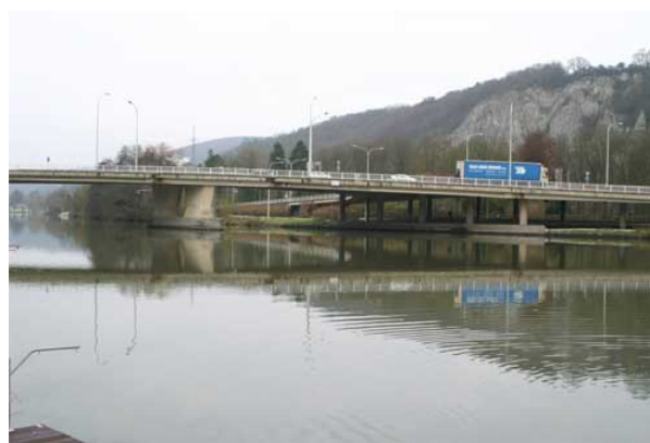
Figure 16 : Pont d'Yvoir