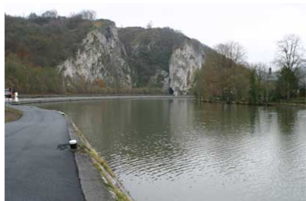
Figure 23 : Port de Monia