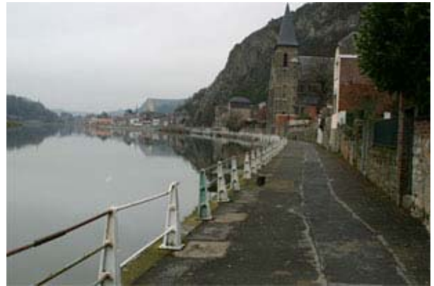
Figure 10 : Aval du port