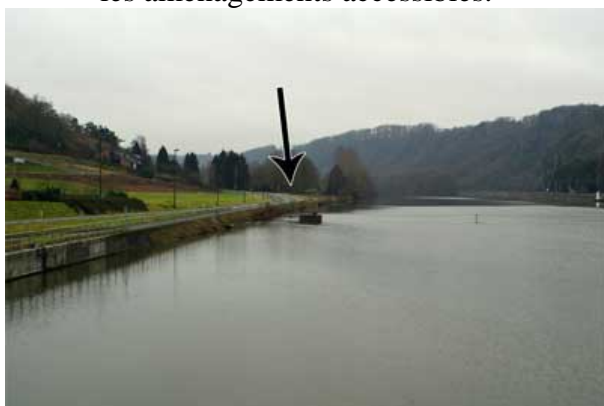
Figure 13 : Amont du barrage de Houx