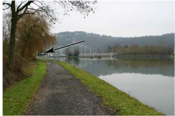
Figure 25 : Amont de l'écluse de Houx

39. En amont de l'écluse de Houx, un accès, le Chemin « Le Caillou » permet de rejoindre le RAVEl en traversant un quartier résidentiel. Un parking pourrait être aménagé au bout de ce chemin afin de permettre le stationnement organisé de quelques voitures.