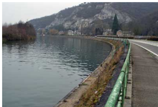
Figure 14 : Banquette en aval du barrage