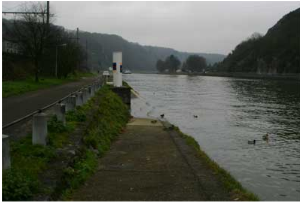
Figure 24 : Derrière l'ancienne gare de Bouvignes

38. Derrière l'ancienne gare de Bouvignes, entre les cumulées 20.500 et 20.600 km, deux rampes sont présentes et permettent d'accéder à 10 m de quai. La remise en état des deux rampes et la surélévation du quai afin qu'il soit légèrement plus haut que le niveau moyen des eaux du fleuve permettrait la pratique de la pêche pour valides et moins-valides. Une place de parking pour moins-valides peut être aménagée à cette hauteur. Une zone de stationnement peut être aménagée entre le talus du chemin de fer et la rue de la Meuse pour les pêcheurs valides.