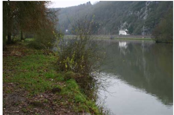
Figure 12 : Ancien Camping de Devant-Bouvignes