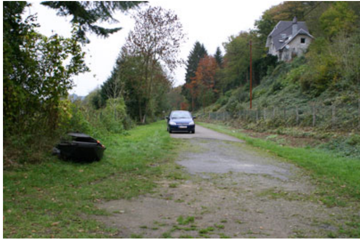
Figure 4 : Rue des Sorbiers