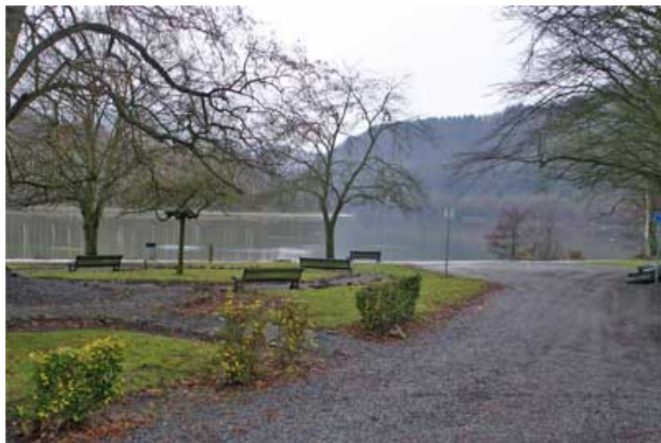
Figure 17 : Parc "Le Paty"