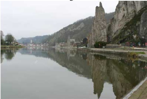
Figure 9 : Port de Froideveau

L'ajout d'un panneau additionnel permettrait à une personne moins-valide de se rendre à l'emplacement de stationnement sans commettre d'infraction. Un aménagement adapté à la pratique de la pêche pour une personne à mobilité réduite est à prévoir en bordure de berge.