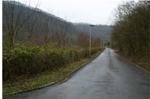
Figure 7 : Non respect du franc-bord