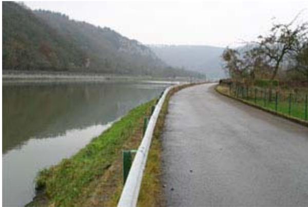
Figure 6 : Banquette en amont du barrage

être envisagé lors d'aménagements liés à la réalisation d'appartements en amont du barrage de Waulsort. Un parking est déjà présent au niveau de l'écluse de Waulsort.