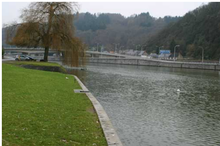
Figure 5 : Rue de la Meuse (Hastière-par-Delà)