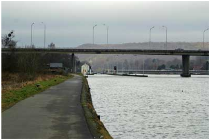
Figure 27 : Amont de l'écluse de Wépion