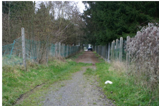
Figure 1 : Rue "La Loqueresse"

léger mais il devrait permettre la mise à l'eau des barques et les déversements dans le cadre des rempoissonnements. Il est nécessaire de pouvoir approcher à proximité immédiate de l'eau avec des bassines. Un ponton collectif d'amarrage de barques de part et d'autre de la rampe constituerait un plus. Cet aménagement n'est pas localisé sur un site Natura 2000 (voir annexe 1).