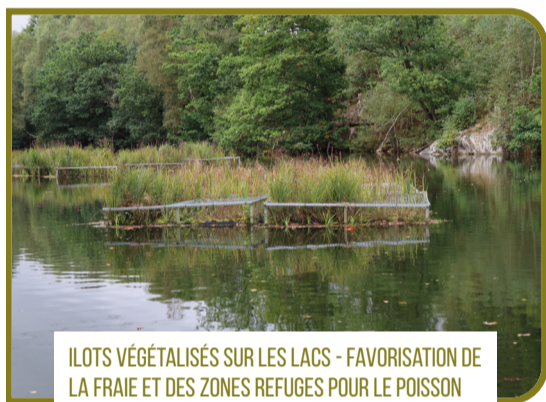
ILOTS VÉGÉTALISÉS SUR LES LACS - FAVORISATION DE LA FRAIE ET DES ZONES REFUGES POUR LE POISSON