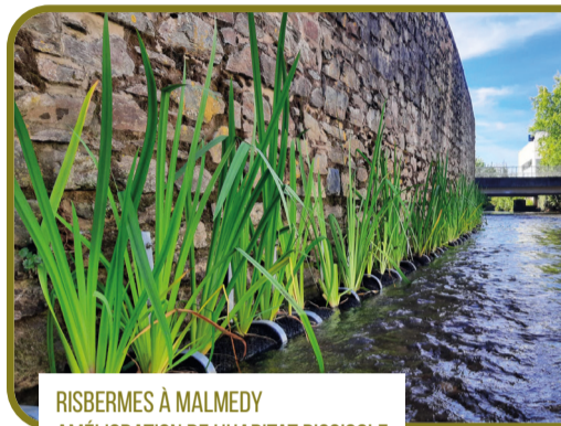
RISBERMES À MALMEDY AMÉLIORATION DE L'HABITAT PISCICOLE